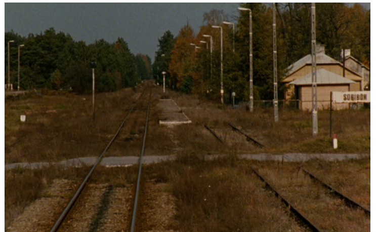
v. l. n. r.: Holocaust-Denkmal Jama („die Grube“) am Standort des ehemaligen Ghettos in Minsk; Bahnhof Sobibor, Polen; Stills aus SOBIBÓR, 14. OCTOBRE 1943, 16 HEURES