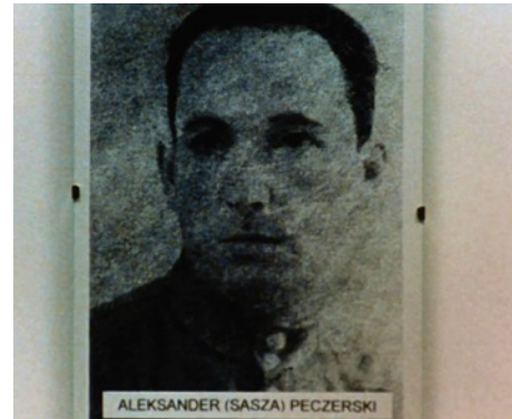
Alexander Petscherski; Still aus SOBIBÓR, 14. OCTOBRE 1943, 16 HEURES