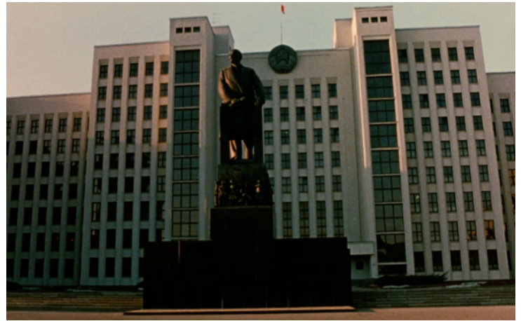
v. l. n. r.: Gedenkstätte Umschlagplatz am ehemaligen Ghetto in Warschau, Polen; Leninstatue in Minsk, Weissrussland; Stills aus SOBIBÓR, 14. OCTOBRE 1943, 16 HEURES