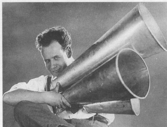
Sergej Eisenstein in Hans Richters Filmstudio London 1929

The film is called THE HOUSE OF THE MASTER. Perhaps it should be called 'THE HOUSES OF THE MASTER'. There are ten houses in the film, among them, his father's house in Riga and the Dacha in Kratowo near Moscow where Eisenstein spent the last few months of his life. Each house represents not only a particular epoch, but