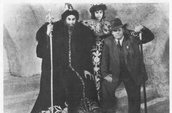
Bei den Dreharbeiten zu Iwan der Schreckliche II : Nikolaj Tscherkassow, Erik Pyriew, Sergej Eisenstein